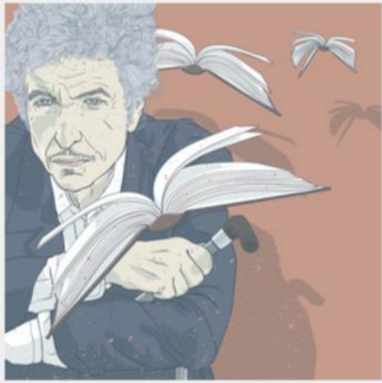
Nobelprijs Bob Dylan