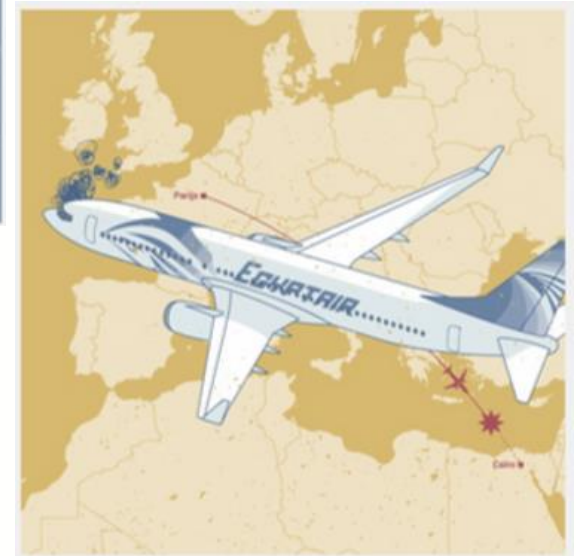
Airbus Egypt Air stort neer