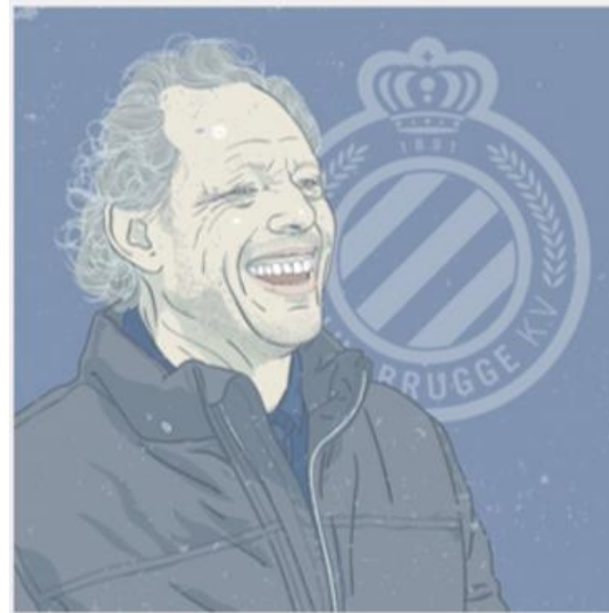
Club Brugge Kampioen