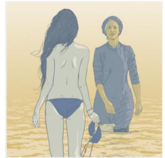
Boerkiniverbod in Frankrijk