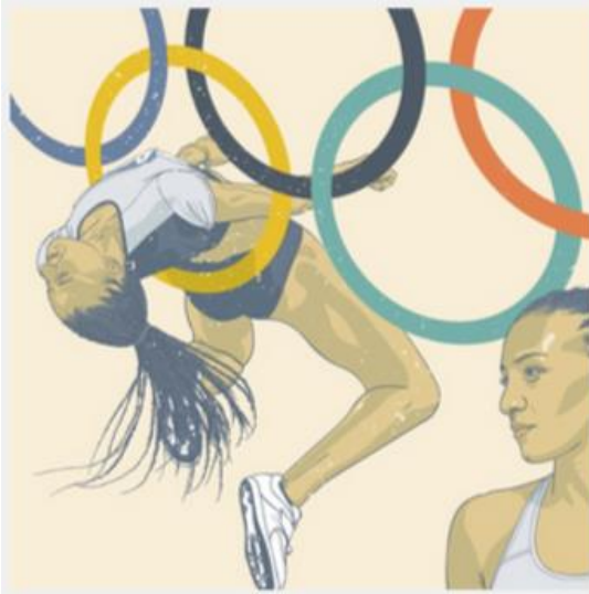
RIO Olympische zomerspelen