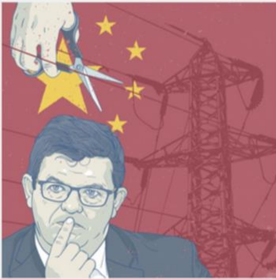
State Grid - EANDIS