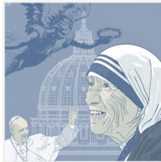
Heiligverklaring Moeder Teresa